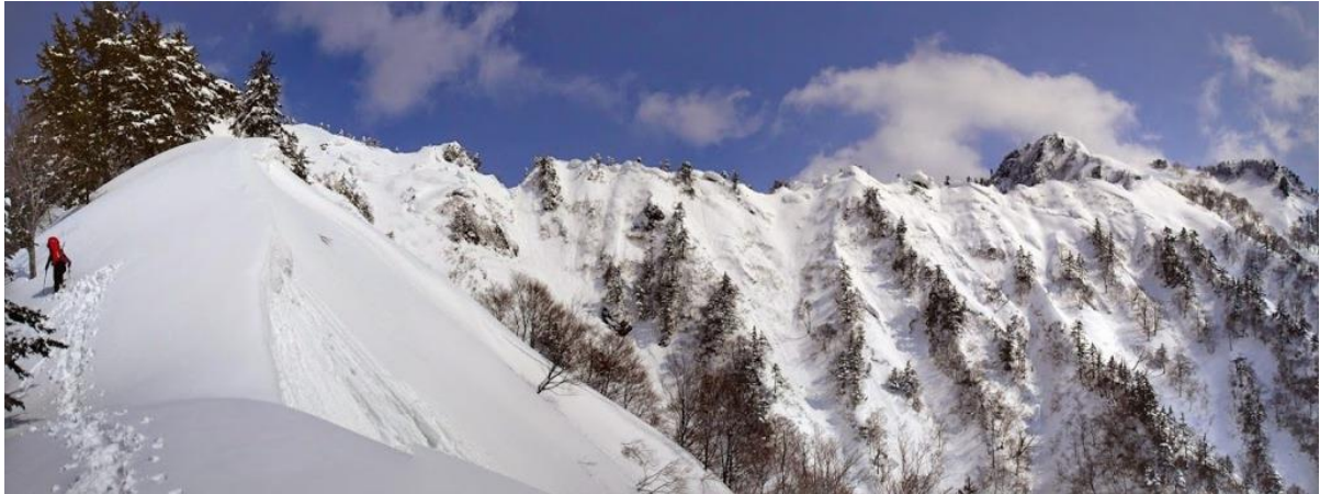
カドナミ尾根から足拍子岳に続く稜線を仰ぐ。

時間もたっぷりあるので昼過ぎからテントでウダウダしながら酒を飲む、暑いのでビールが格別。晴天は一転、午後は小雪が舞いあつという間にホワイトアウト。天気周期が目まぐるしい。日頃の睡眠不足解消で 19:00 には消灯、気温は高く 3 シーズン・シュラフでも快眠だった。