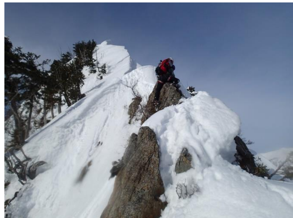
南峰からみた足拍子岳・本峰（左）と、南峰のナイフリッジを馬乗りで越える。（右）

下りの南尾根でも踏み抜きが多く、雪は触ればすぐに水分となりグローブも足元もビチョビチョ祭りとなった。土樽駅に着いたのがちょうど日が暮れる直前、日の出から行動して日の入りまで結局 12 時間労働を強いられた。