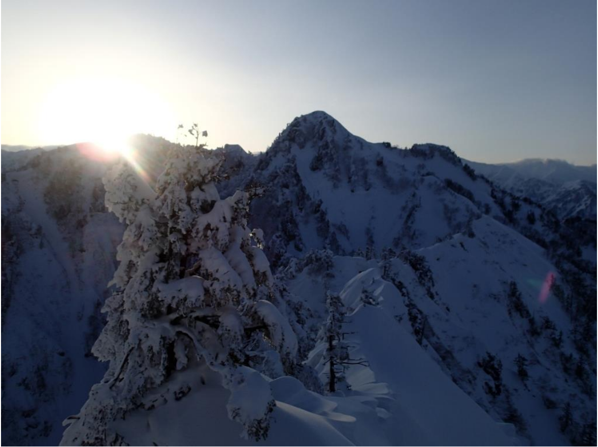
朝日を浴びて足拍子岳を目指す。