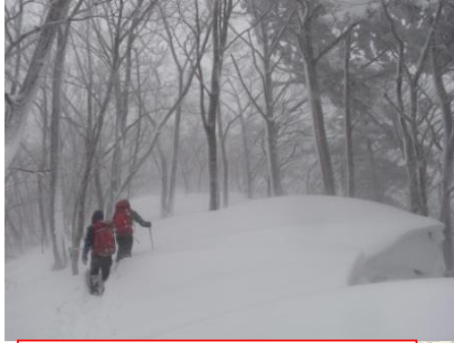
③ 塩原側(南東)に雪が溜まっている