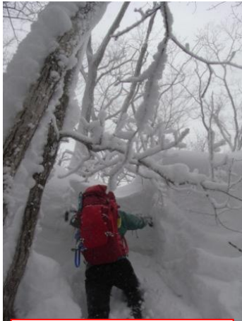
② 雪庇を崩して稜線にでる