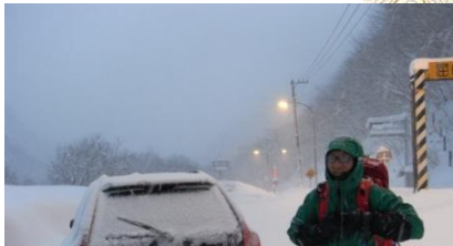
① 駐車場は未除雪だった