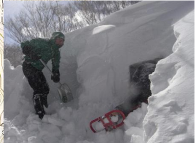
⑤ 雪洞訓練で時間つぶし